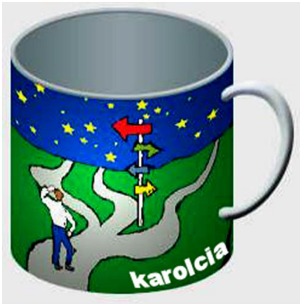
Graphic design of the mug