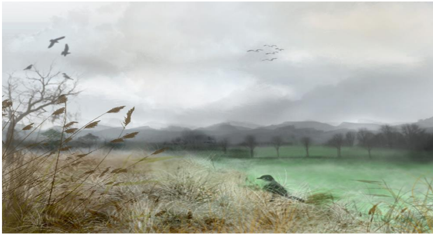
Photo numérique prise avec un pinceau numérique