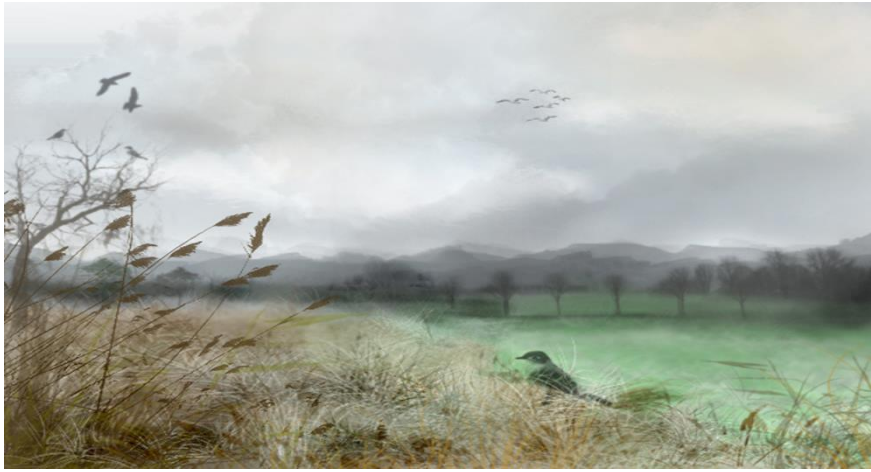
Digitales Foto, das mit einem digitalen Pinsel aufgenommen wurde