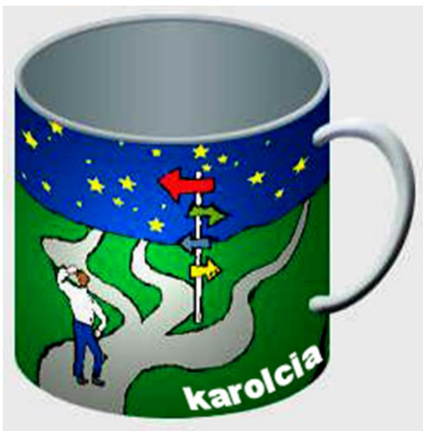
Grafische Gestaltung des Bechers