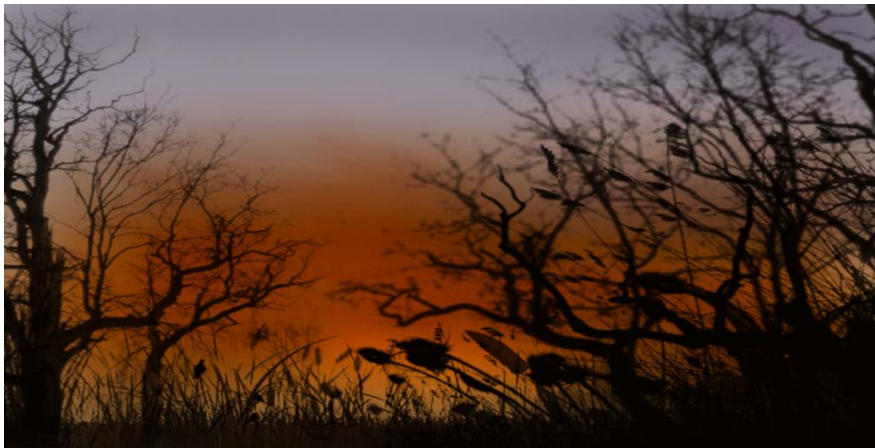
Beispiele für Schülerzeichnungen, die mit der Anwendung Photoshop erstellt wurden