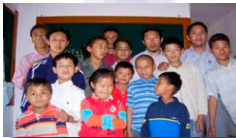
École de Chauntra