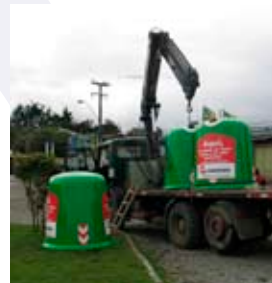
Bras hydraulique Centre Coaniquem