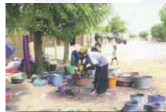
Teinture de tissus, Ségou