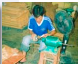
3 des 10 machines achetées grâce au Comité Tiers Monde