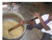
Centre de développement agro-pastoral