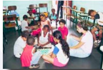
Le centre Corassol