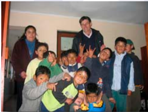
Enfants de la Ciudad del Niño Jesus