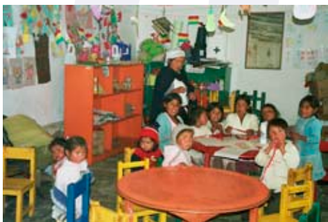
PAN: Programa de Ayuda a Niños