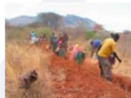
Pose d'une conduite d'eau