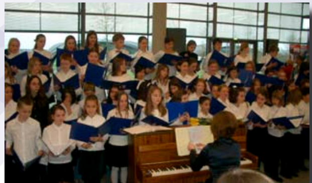
La chorale Robert Schuman