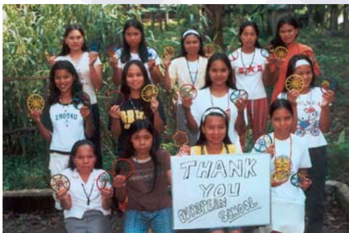
Les remerciements d'un atelier de jeunes filles aux Philippines.

D epuis 1983 le Comité Tiers Monde s'attache à informer et sensibiliser les élèves aux problèmes des populations défavorisées et à collecter des fonds pour soutenir divers projets de développement dans le monde.