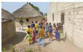
École de brousse