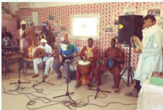
Jeunes musiciens de l'association culturelle Diran