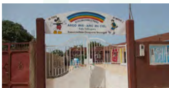
Arc en Ciel