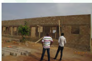
Gandado - construction d'une école primaire