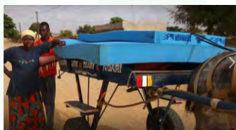
La Maison des Enfants d'Awa