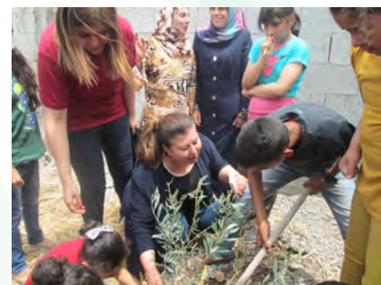
Plantation d'oliviers près de la construction