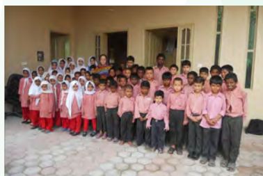
Élèves de l'École de Qalam, école pour enfants défavorisés

Achat d'équipement pour la nouvelle salle d'informatique/ Purchase of equipment for the new computer room ..... 2 000 €