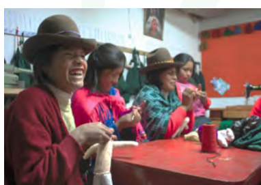
Atelier de travail artisanal

Construction d'un centre culturel pour les enfants de la communauté Quechua, scolarisés et hébergés à Ccorca / Construction of a cultural Centre for the Quechua children attending school and boarding in Ccorca ..... 3 000 €