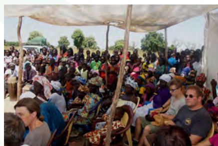
Des collégiens, des mamans accueillent quelques membres de EBS Luxembourg

Subvention pour les matériaux de construction d'une nouvelle classe dans le collège d'enseignement moyen / Funding for the building materials of a new classroom in the middle school ..... 2 500 €