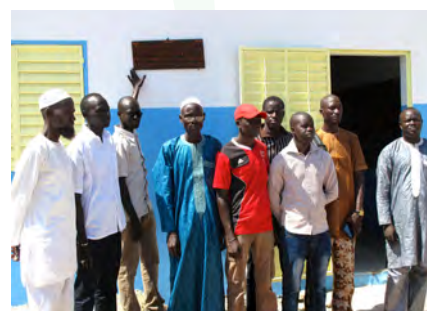
Le directeur et les enseignants