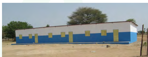
Triple classe terminée en juillet 2015

Achat de matériaux pour la construction de trois salles de classes / Purchase of materials for building three classrooms ..... 1 500 €