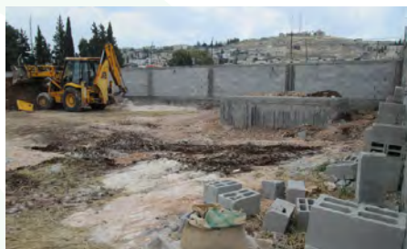
Construction du nouveau centre

Subvention pour équipement et matériel de bureau pour le Centre psychosocial / Purchase of office equipment for the new Social Centre ..... 2 500 €