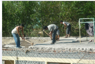
Démolition en cours