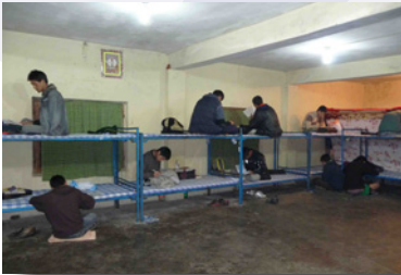
Dortoir insalubre, rongé par l'humidité