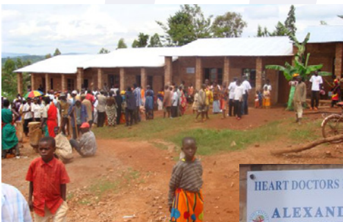
Inauguration de l'école primaire mars 2010