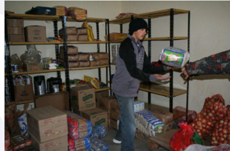
Réception des aliments