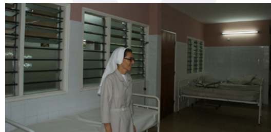
La nouvelle maternité