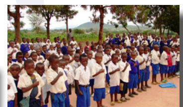
Enfants de l'école primaire