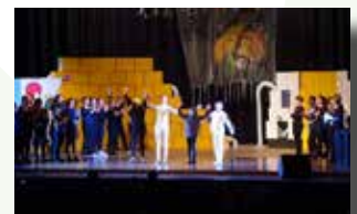
The Wizard of Oz