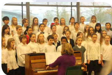
La chorale Robert Schuman ouvre le Marché de Noël