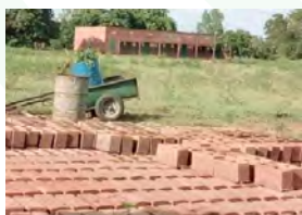
École de Bwam et les briques pour les toilettes