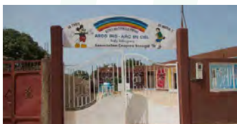
Arc en Ciel