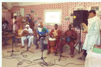
Jeunes musiciens de l'association culturelle Diran