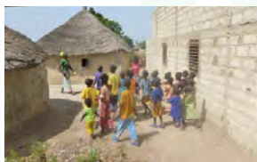
École de brousse