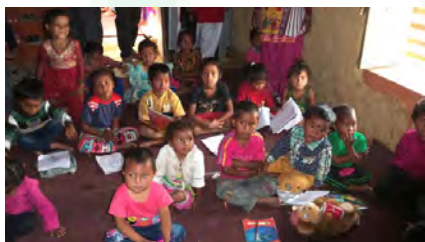
District de Surkhet