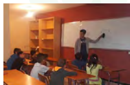
Nouvelles bibliothèques pour l'association «Assirem Ait Bouyahia»