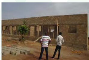
Gandado - construction d'une école primaire