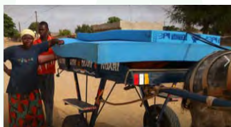
La Maison des Enfants d'Awa